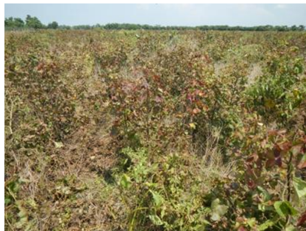
Imagen N°1. Rebrote de algodón controlado con herbicida en zona vetada de Córdoba.

En el norte del departamento del Cesar se extendió la fecha de siembra hasta el diez de septiembre debido a la falta de agua lluvia, algunos agricultores han tenido que resembrar por la falta de humedad en el suelo, en esta zona norte se han establecido 550 ha aproximadamente, en la zona sur del Cesar se han sembrado a la fecha solo 150 ha por los mismos motivos.