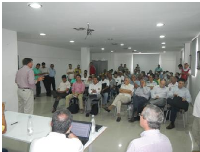
Imagen N°2. Socialización de la política algodonería, cosecha Costa 2015-2016

mayor será el incentivo, esto con el fin de estimular la productividad del algodonería, también hizo énfasis en el manejo sanitario del cultivo, principalmente a los controles de picudo, quien no esté certificado por el ICA con una destrucción de socas en 100% y haya instalado los tubos mata picudos no recibiera subsidio. Estas mismas políticas del MADR fueron presentadas a los productores algodonerías en la ciudad de Valledupar el día 21 de agosto en el auditorio del ICA.