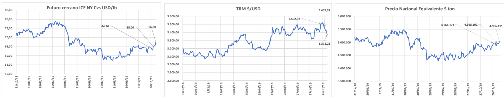
Futuro mas cercano del ICE NY, Tasa Representativa del Mercado $ / USD y Precio Nacional Equivalente $ ton Cotizaciones diarias

Nota: Las últimas lecturas son los viernes 29 de noviembre, 6 Y 13 de diciembre de 2019